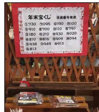
特別企画 (年末宝くじ)