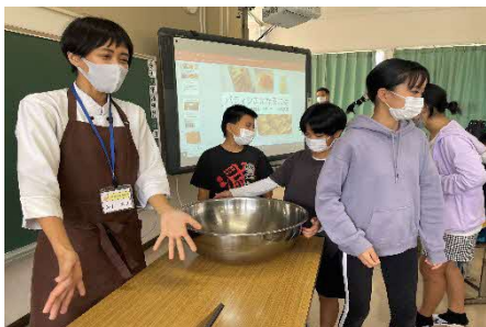
【パティシエ：美ら卵養鶏場】