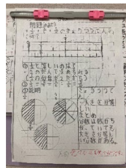
【家庭学習ノートの掲示】