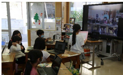
【他の離島との交流学习】