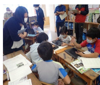
【ツールを使つての考えの発表】