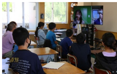
【アナウンサーによるキャリア教育】