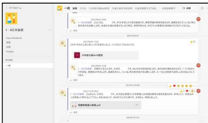
(1) Teams を利用した遠隔授業 ↑