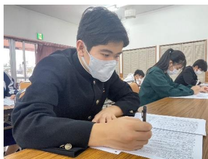
② 受験対策合宿の様子