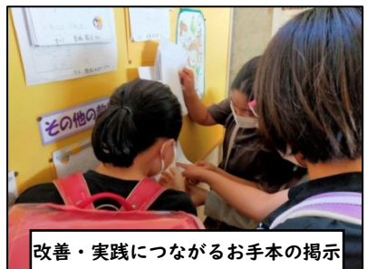
改善・実践につながるお手本の掲示