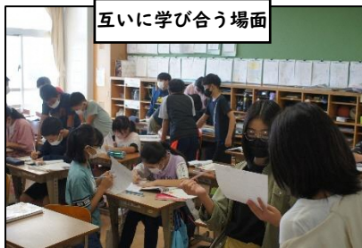
互いに学び合う場面