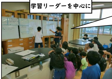
学習リーダーを中心に

みんなで結論を話し合しましょう。 各グループの結論で同じ所や違う所はありますか?