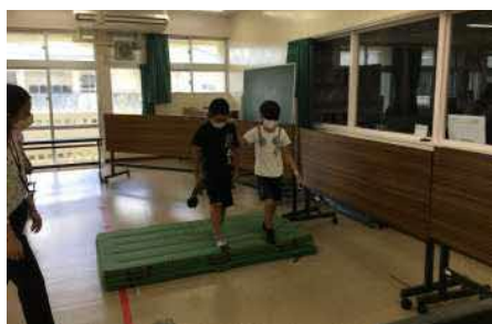
【 アイマスク体験 】