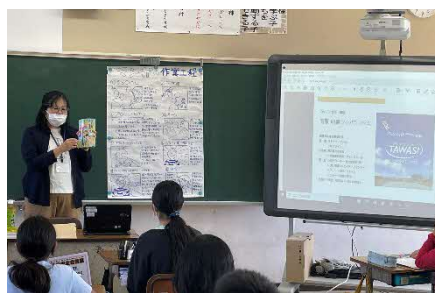
【 キャリア教育 】