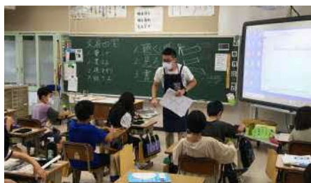
【 毛筆指導 】