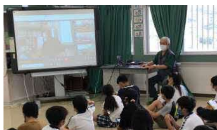
【 平和学習 】