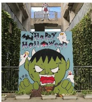
↑ 季節の行事等を大壁画で表現し、学校活性化を図る