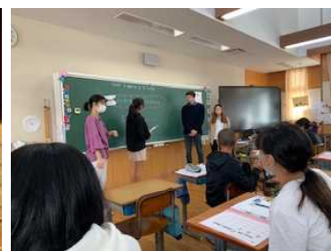
オランダのゲストと授業 (大里南小学校) ↑