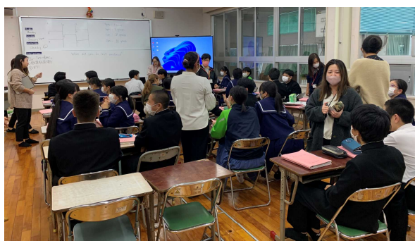
ALT 達と Small Talk