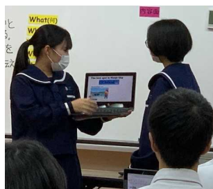
話し手と聞き手のやり取り