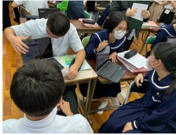
伝わるように話す