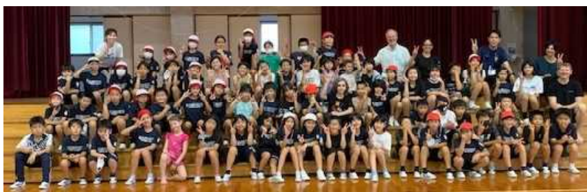
スイスからのゲストと交流 (佐敷小学校)