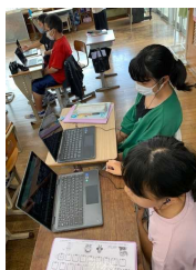
佐敷小学校と南風原小学校 (自己紹介)