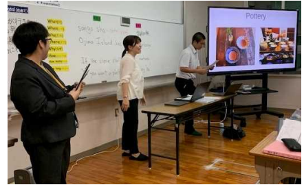
練習の成果をプレゼン

佐敷中学校は全校体制で「言語活動を通して」学ぶ授業を実施。4月の全国学力テストの話すこと調査は全国平均を上回った。10月の英検 IBA でも3年生は高得点。