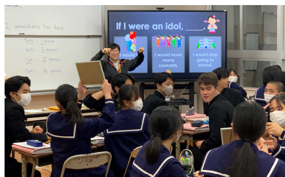
自分の考えを伝える

小学校担当の ALT が中学3年生になるとこんなに話せると驚き感動した。小学校外国語活動と外国語でやることを再確認