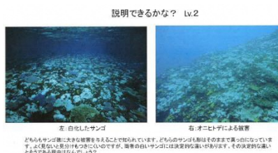
「サンゴの白化現象について」