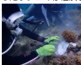
「ネームプレートの設置」