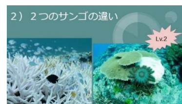
「調べ学習パワーポイントスライド②」

(2) 体験学習：「サンゴや海中の生き物の観察」を目的とした体験ダイビングの実施と3年生による「サンゴの保全・再生」を目的としたサンゴの移植及びネームプレートの設置を行った。