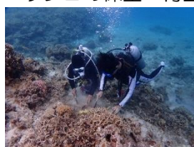
「サンゴ移植設置場所の清掃」

(2) 体験学習：「サンゴや海中の生き物の観察」を目的とした体験ダイビングの実施と3年生による「サンゴの保全・再生」を目的としたサンゴの移植及びネームプレートの設置を行った。