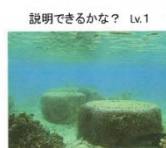
「調べ学習パワーポイントスライド①」