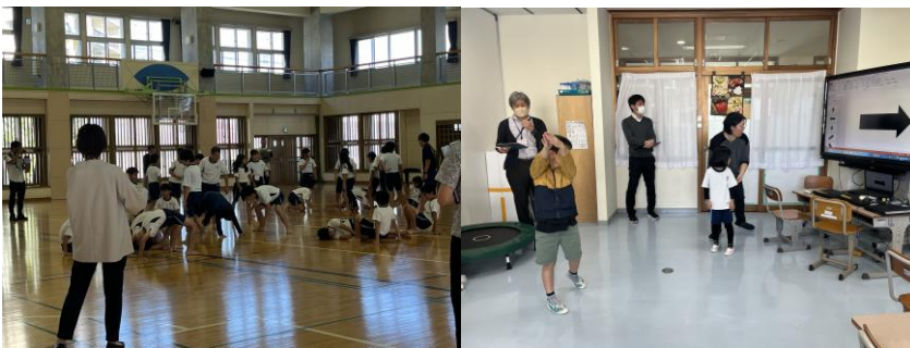
写真1 一人一授業の様子

一人一授業・二参観を行い、校長や教頭が授業参観を通して助言をし、教科指導に優れた教師や経験豊富な教師の授業を参観することで授業力向上を目指している。授業を参観する際には、授業観察フィードバックシートを活用し、明確な視点をもって授業参観を行い、授業者にフィードバックすることで、授業改善につなげている。(写真1, 図3)