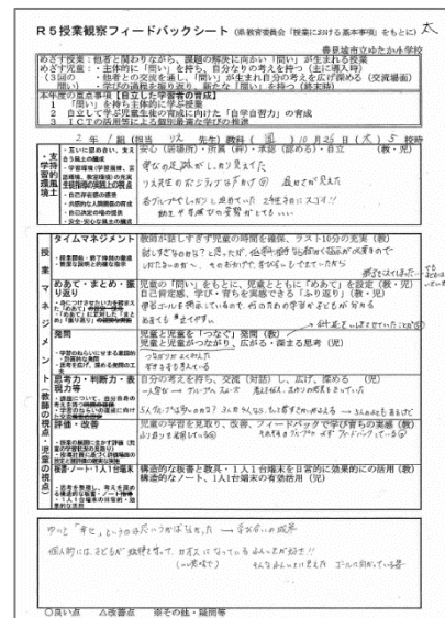
図3 授業観察フィードバックシート