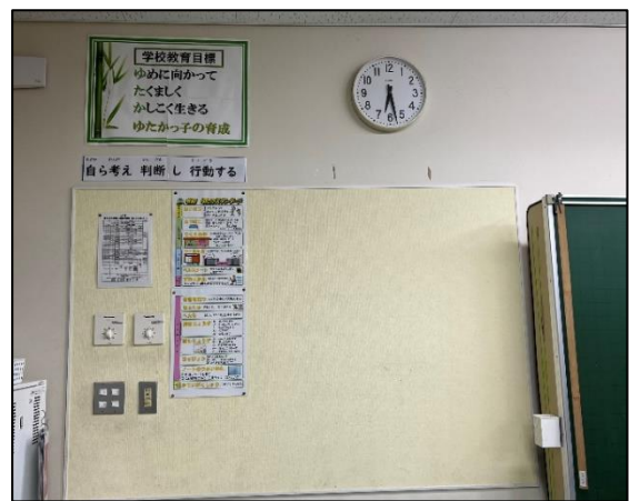
図2 教室前面の掲示