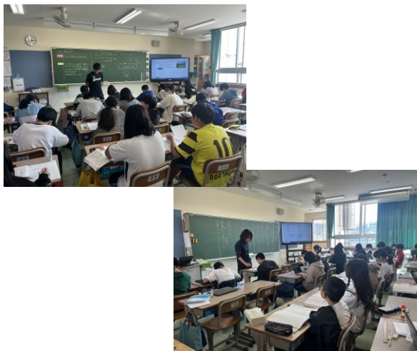
写真2 5学年の教科担任制の様子 (1組で3組担任が3組で1組担任が授業)

3~6年生担任は, 初任者を除く複数のクラスで授業を受け持っている。学年に応じて, 国語や算数, 体育や社会を教科担任として実施している。1・2年生担任は, 学期に1回程度, 他クラスの授業を受け持つ時間を設けている。受け持つ教科が絞られ, 同じ内容の授業を複数のクラスで行うことができるので, 教材研究の質を高めることができ, 授業力向上につなげることができた。(写真2, 図4)